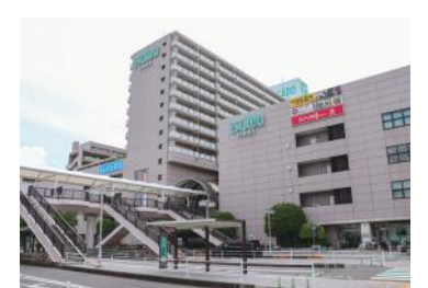
牛久駅西口エスカード牛久ビル

また、これらの取り組みのほかにも、牛久シャトーや牛久大仏などの観光資源や、豊富な地域資源を生かした、ワクワク、ドキドキするようなイベントや仕掛けを新たなチャレンジャーとして取り組みながら、魅力的な活力あるまちづくりを加速させてまいります。