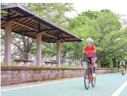
つくば霞ヶ浦りんりんロード

子どもが夢と希望を持ち、生き生きと育つまちづくり このプロジェクトでは、「かがやけ！土浦の子どもたち」を合い言葉に、未来を担う子どもたちが地域とのつながりのなかで、心身共に健康やかに、生き生きと育ち、土浦を故郷として誇りに思うことができるまちを目指します。