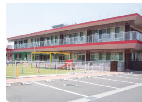
認定こども園 土浦幼稚園

今日、人口減少や少子高齢化が進行する中、光熱費や生活必需品の慢性的な高騰に加え、様々な業種において人手不足問題が生じるなど、これらが社会経済活動に大きな影響を及ぼしています。 本市におきましては、この経済危機から市民の皆様や事業者の皆様を守り抜くため、多くの方々の声に耳を傾けながら、様々な支援策を構築し、着実に進めているところです。このような中、本市は、これまで種をまいたものが、ようやく実を結び始めるなど、明るい兆しが見え始めております。