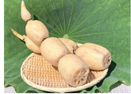
土浦市特産品 れんこん

安心して市民生活を支える災害に強いまちづくり このプロジェクトでは、自然災害の激甚化や、感染症の流行期などに自然災害が発生した場合の複合災害に備え、 各インテリジェント周辺地区における企業誘致に向けた土地利用の誘導や、新規事業化が決定した(仮称)土浦スマートICの早期実現に向けた取り組み、れんこんを核とした農業振興などを推進することで、地域経済の活性化を図ります。