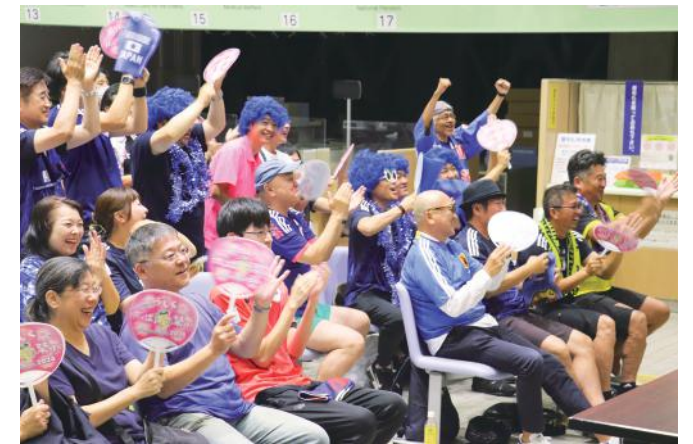
オリンピックサッカー日本代表戦 バブリックビューイング

令和6年度は、牛久市の福祉部門で取り組む事項を定める「牛久市地域福祉計画・成年後見制度利用促進計画・地域福祉活動計画」の中間見直し年にあたります。子どもから高齢者まで、障がいのある人もない人も、一人ひとりが尊重され、住み慣れた地域で主役として様々な活動に積極的に参画し、生きる力や可能性を最大限に発揮できるよう、地域福祉の一層の充実に向け、市内ワーキングチームを設置し、各事業内容の検討・見直しを進めています。また、昨年5月に法律が制定され、9月が「認知症月間」と定められるなど、高齢化社会が進む中、国を挙げて認知症への取り組みが進められています。