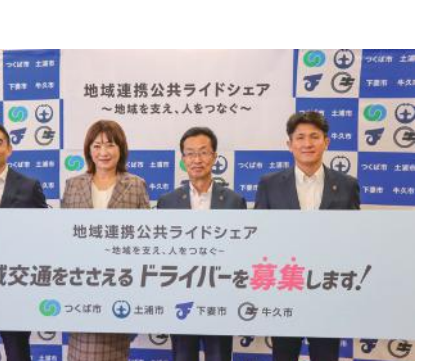
地域連携公共ライドシェア

近隣のつくば市、土浦市、下妻市と連携し、広域でドライバーを共有するドライバーバンクを本年10月に設立し、利用者としてドライバーをAIにて効率的にマッチングするアプリを利用した運行を来年1月より予定しております。これにより、ドライバー不足によるタクシー車両台数制限の緩和や、予約の効率化が見込まれ、地域の皆様の持続的な移動手段の確保が期待されます。