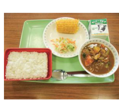
7月5日「牛久の日」給食

物価高騰対策 近年の物価高騰を受け、市内商業の発展と地域振興を図ることを目的に年2回発行されている商品券「ハートフルクーポン券」について、プレミアム分を10%から20%へ拡大しています。そして、より多くのご家庭が利用できるよう、1世帯あたりの購入上限額を10万円から5万円に変更したほか、令和6年12月1日発行分より、購入申込が牛久市公式LINEでも可能となりました。