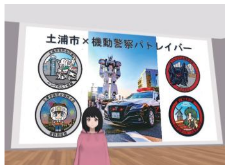
メタバース空間 バーチャルつちうら

ハード・ソフトの両面から災害被害を最小化し、市民の生命、財産、そして生活を守る取り組みを推進することで、市民が安心して暮らせる災害に強いまちを目指します。 具体的には、県内ではいち早く結成した、地域防災サポート連協協議会の活動を加速し、新たに各地区の自主防災組織とも連携を図ることで、市民の防災意識の高揚と、地域防災力の更なる強化につなげるとともに、国土強靱化に向けて、急傾斜地崩壊対策、